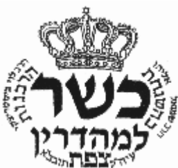
Rabbinat de Tsfat Mehadrin