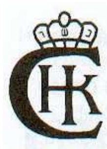
Beth Din de Crown Heights (Loubavitch) Viandes et certains vins