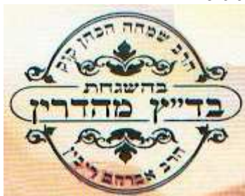
Rabbinat de Rehovot: Rav Kook et Rav Roubin (ou seul)