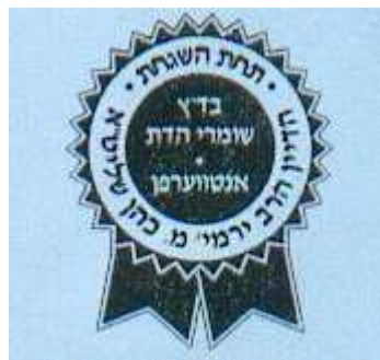
Rabbinat d'Anvers: Chomrei Hadat