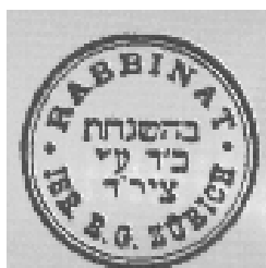
Le Rabbinat de Zurich