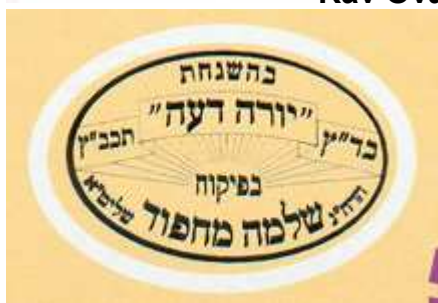
Rav Chlomoh Mahpoud Beth Din Yoré Déah