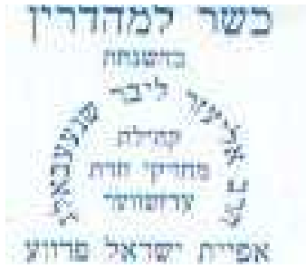
Le Rav Eliezer Lieber Schneebalg (Communauté de Edgware)