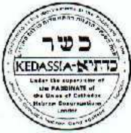
Beth Din Kedassiah de Londres