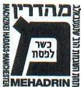
Mahzikei Hadat de Manchester